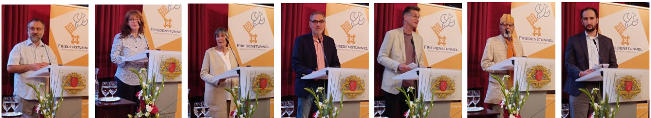
Impression „Frieden konkret“ – 10.09.2024 im Bremer Rathaus