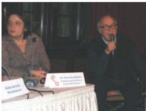
02. November 2011 Podiumsdiskussion in der Reihe „Frieden konkret“ „Was liegt mir am Herzen - interreligiöses Kamingespräch zu Fragen von Leben und Tod“ Kaminsaal des Bremer Rathauses

Ein herzliches Dankeschön allen Mitarbeitern, finanziellen Förderern und Interessierten unseres Friedenstunnel-Projekts