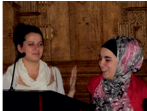
22. September 2011 Präsentation des Schulprojekts "Frieden fängt klein an!" mit Kulturstaatsrätin Emigholz und den Religionsvertretern des Vereins und mit mehr als 300 Schülern der Jahrgänge 9 - 12 in der oberen Rathaushalle